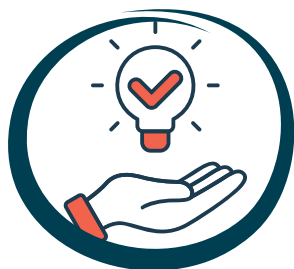
Dominio de la Metodología ApS