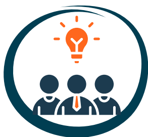
Liderazgo en Innovación y Compromiso Social